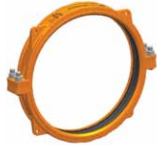
DIMENSIONI 26 – 60"/ 660 – 1525 MM BREVETTATO