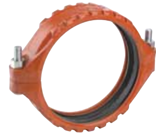
DIMENSIONI 14 – 24"/ 350 – 600 MM BREVETTATO