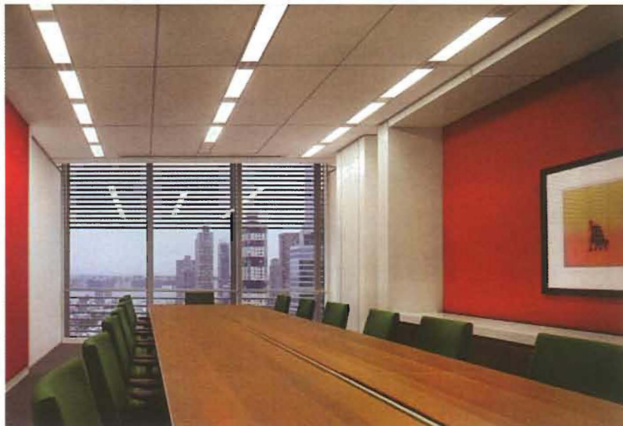
3 Nei piani occupati dalla redazione del giornale è stato adottato un sistema di distribuzione dell'aria a pavimento con diffusori con flusso d'aria a spirale.

sione viene distribuito alle batterie delle UTA ubicate nelle centrali tecniche poste ai piani interrati e in copertura e viene utilizzato per produrre acqua calda per il sistema di riscaldamento perimetrale che consiste di cassette ventilate ( fan-powered boxes ) dotate di batterie calda. Il vapore viene inoltre impiegato per il sistema di umidificazione dell'aria utilizzato per la parte occupata dagli uffici del giornale.