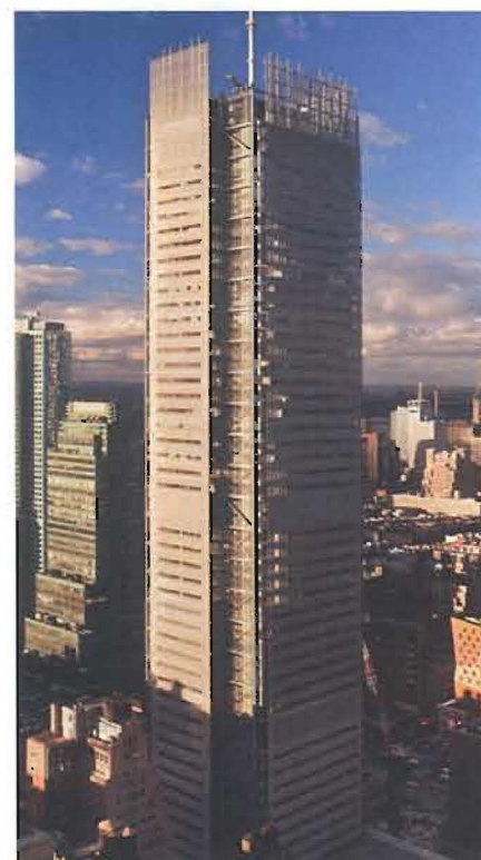
1 Il grattacielo della nuova sede del New York Times si sviluppa su 52 piani ed è alto circa 250 metri.