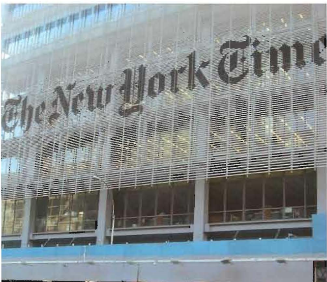
2 La facciata vetrata è ricoperta da uno schermo esterno realizzato con tubi orizzontali in ceramica bianca che arrestano la luce diretta del sole consentendo la visione

plici sono state le soluzioni adottate sotto l'aspetto della compatibilità ambientale. Come ad esempio l'impianto di cogenerazione che fornisce una potenza di 1.400 kW ed è composto da due motori endotermici alimentati a gas funzionanti in parallelo. L'impianto, oltre a consentire alla redazione di continuare a lavorare anche in caso di blackout, produce acqua calda che viene utilizzata per alimentare un gruppo frigorifero ad assorbimento da circa 800 kW nonché per il sistema di riscaldamento perimetrale. In estate si riduce in tal modo la potenza elettrica assorbita dalla centrale frigorifera che risulta completata da 5 gruppi centrifughi da 3.500 kW ciascuno. Le pompe di circolazione dell'acqua sono tutte a velocità variabile regolata da inverter, mentre il circuito dell'acqua di torre permette di realizzare il free-cooling durante i mesi freddi.