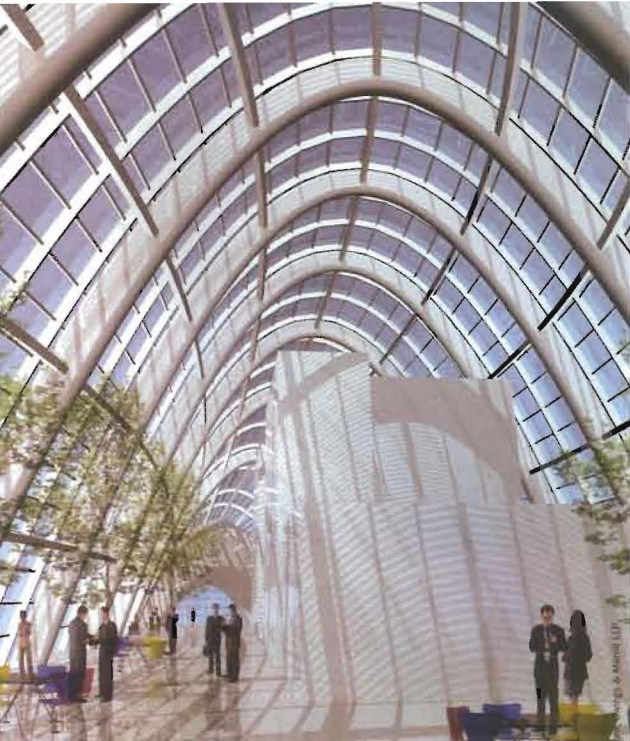
5 All'ultimo piano della torre il progetto prevede l'impiego di pannelli fotovoltaici integrati nella copertura vetrata.

di energia eolica integrato nel disegno della costruzione. L'edificio W presenta quattro grandi aperture realizzate nella struttura, previste a coppia su ognuno dei due piani dedicati agli impianti meccanici, nelle quali sono installate quattro piccole turbine eoliche (figura 6).