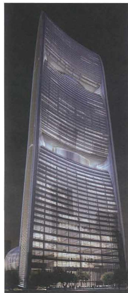
6 La facciata è dotata di 4 grandi aperture nelle quali sono collocate turbine eoliche in grado di produrre 10.000 kWh all'anno.

La simulazione ha dimostrato che grazie ai