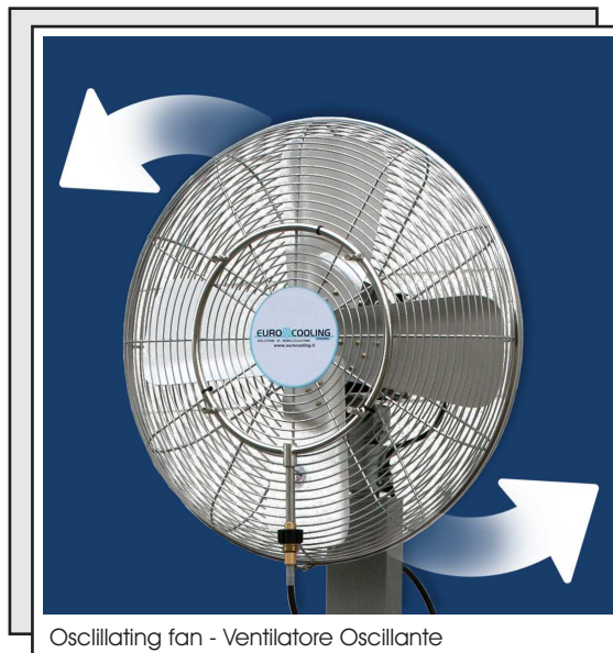
Oscillating fan - Ventilatore Oscillante

Fill up the tank with clean fresh water, plug-in, switch on. In a while a fresh breeze will make your summer more pleasant.