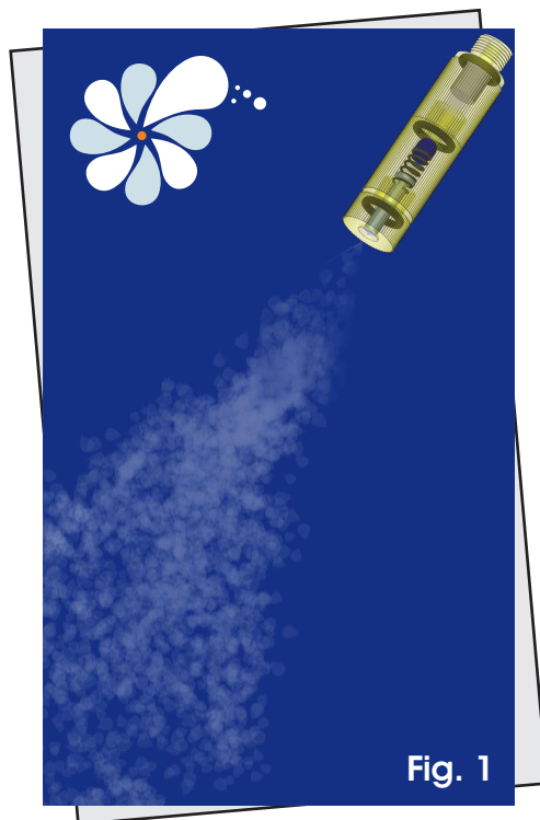
Millions of less than 10 microns droplets sprayed by our fog nozzle.

By forcing water, by means of a high pressure pump, through our specially designed misting nozzles, we create a fog of ultra fine water droplets with an average size of less than 10 microns. These tiny water droplets quickly absorb the energy (heat) present in the environment and evaporate, becoming water vapor (gas). The energy (heat) used to change the water to gas is eliminated from the environment, hence the air is cooled.